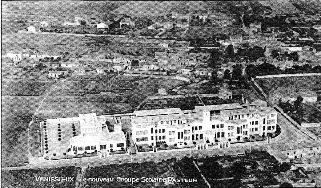
VENISSIEUX - Le nouveau Groupe Scolaire PASTEUR

L'école Pasteur, et plus particulièrement sa façade, a toutes les chances d'accéder au rang de monument historique. Une opportunité à ne pas rater dans l'optique de la réhabilitation