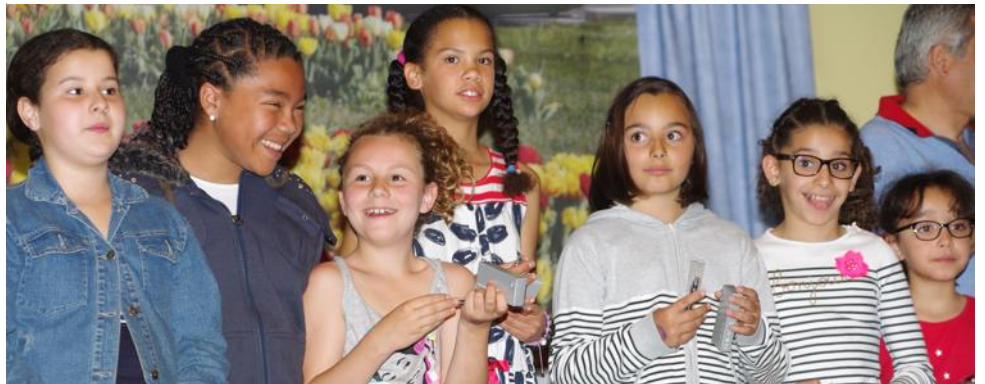
■ La relève est assurée pour l'ALVP basket, avec l'équipe poussine, championne départementale cette saison.

Avant le buffet, qui a conclu cette soirée, une partie des 33 athlètes de haut niveau, récompensés en septembre dernier par la municipalité, sont également montés sur la scène. ■