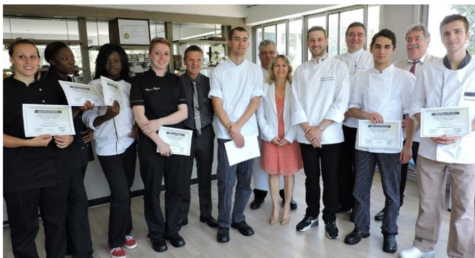
■ Les élèves, ravis de cette rencontre instructive et professionnelle avec un champion du monde accessible et disponible.

Jeudi après-midi, dix élèves (cinq filles et cinq garçons), de la mention complémentaire cuisiniers en desserts de restaurant, du lycée Hélène-Boucher, ont reçu leur attestation de formation de mains de Joffrey Lafontaine, champion du monde de la pâtisserie 2013 (glace et sculpture sur glace). Ce grand professionnel de la pâtisserie a été